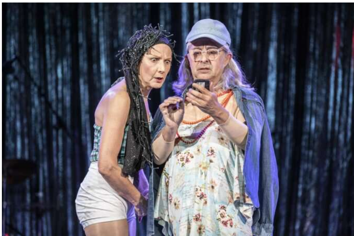
Agrandir l'image : Illustration 2

Maillet a eu la sagesse de transformer en dispositif. Le Reno Sweeney, qui accueille dans les années soixante-dix et quatre-vingt les artistes de la marge, qu'elle soit sociale, genrée ou les deux à la fois, fonctionne ici comme ce que Pierre Nora appellerait un lieu de mémoire , mais d'une mémoire en contrebande, non institutionnelle, celle des corps qui n'ont pas eu le droit à une grande historiographie[2].