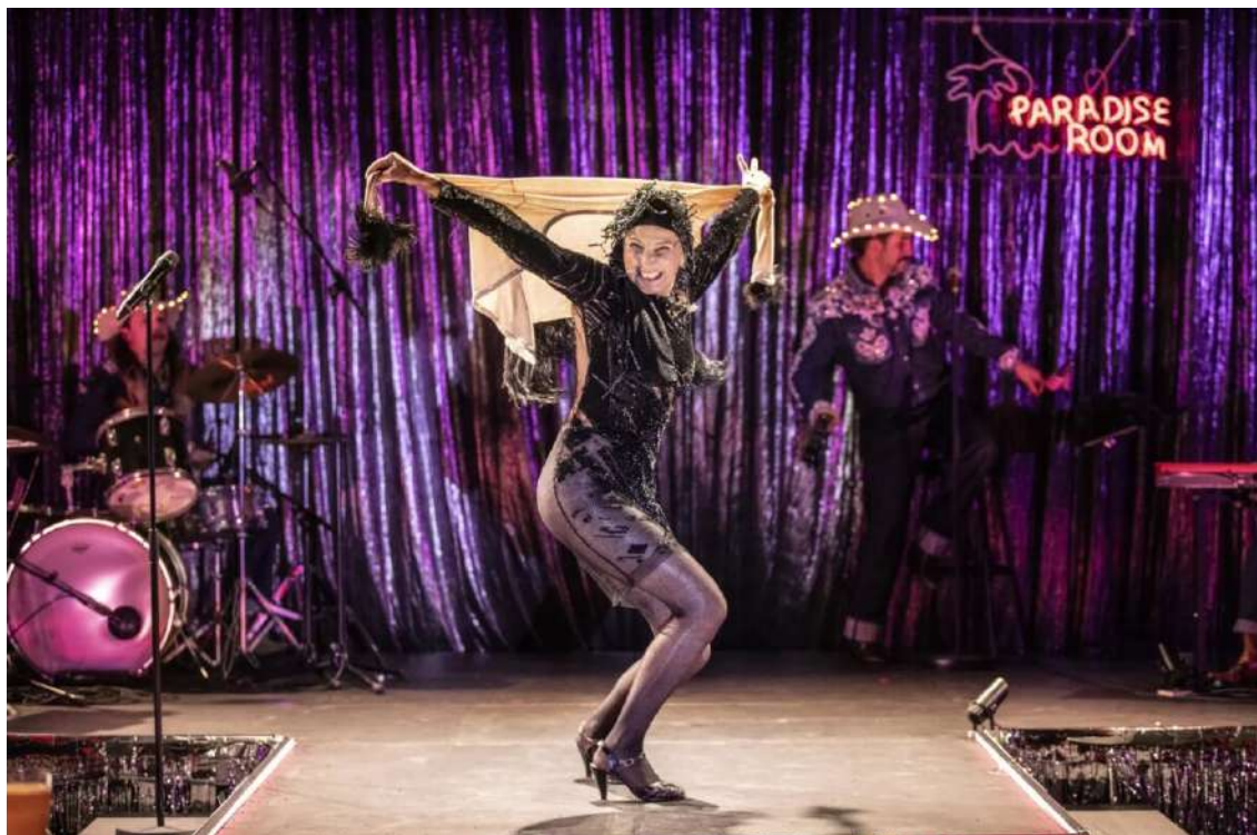
Agrandir l'image : Illustration 1