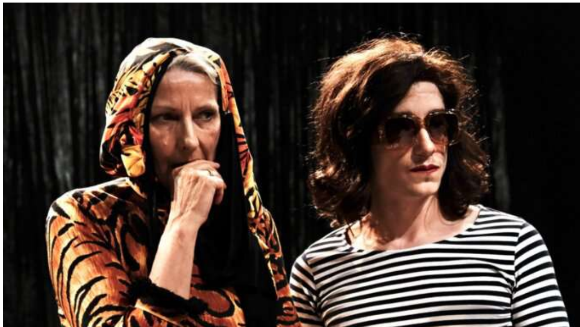
Agrandir l'image : Illustration 8

Edith Beale au Reno Sweeney, Sara Stridsberg, Pierre Maillet, Les Gens Déraisonnables © Jean-Louis Fernandez