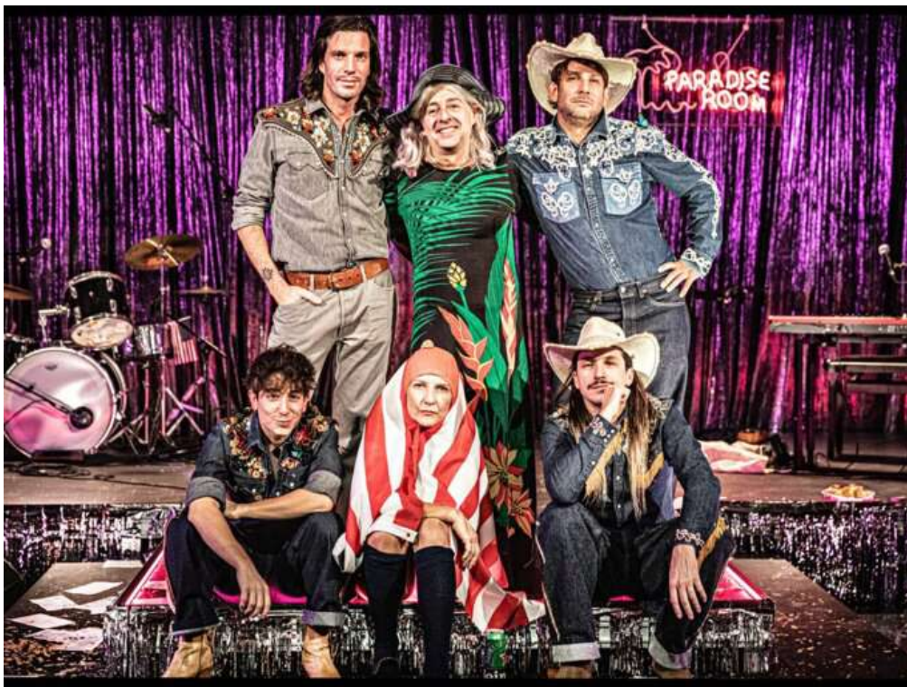
Agrandir l'image : Illustration 12

2bis, avenue Franklin D. Roosevelt 75 008 Paris