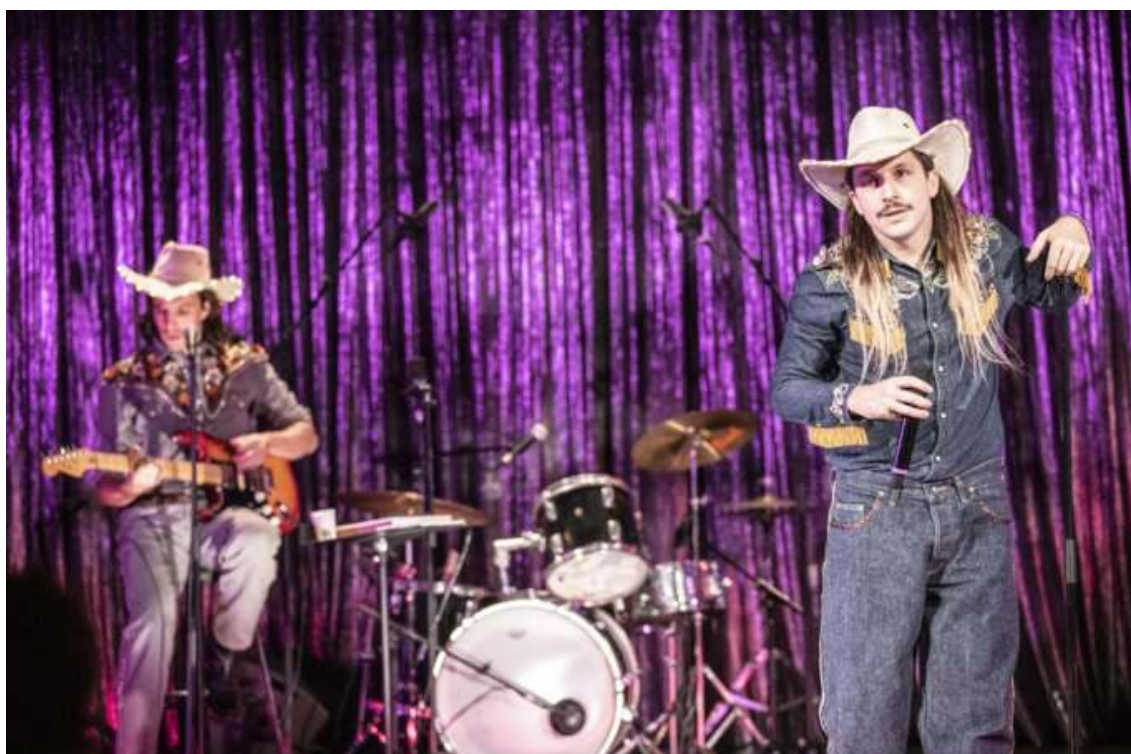
Agrandir l'image : Illustration 11

[9] Susan Sontag, Notes on camp , Penguin Books, 2018, 58 p.