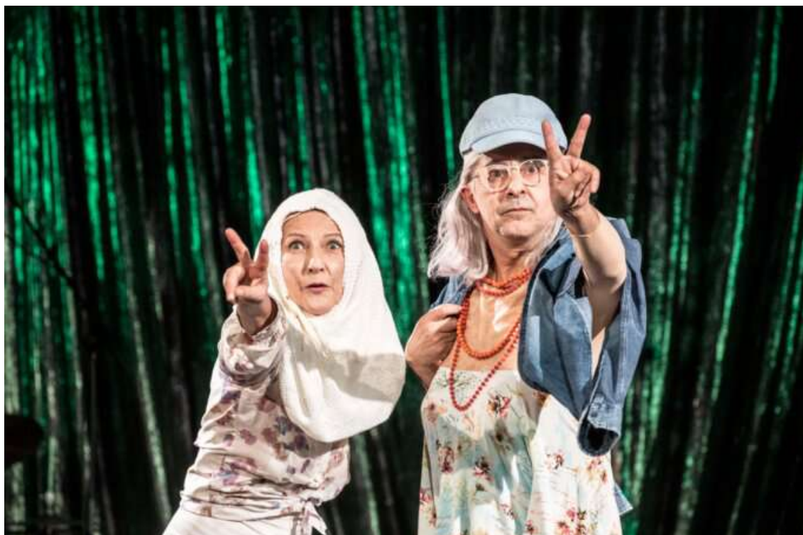
Agrandir l'image : Illustration 5

filment les deux Beale jouant à être elles-mêmes, reconstituant pour la caméra ce qu'elles ont été, ce qu'elles auraient pu être, ce que les autres ont été pour elles. La vie elle-même y était déjà théâtrale, non par coquetterie, mais parce que le théâtre était l'unique espace où une subjectivité exclue du monde social pouvait encore s'affirmer.