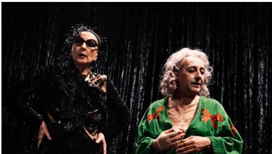
Agrandir l'image : Illustration 3

ce que capte le film des Maysles avec une rare empathie dans l'histoire du cinéma documentaire n'est pas une déchéance mais une résistance. « Little Edie » invente ses propres « costumes », des jupes portées à l'envers comme turbans, des broches sur des foulards improvisés, des maillots de bain en guise de tenues de jour. Sa mode créatrice existait non pas malgré ses conditions de vie, mais à cause d'elles.